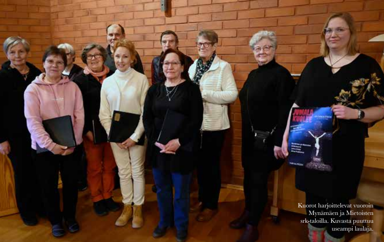
Kuorot harjoittelevat vuoroin Mynämäen ja Mietoisten srk-taloilla. Kuvasta puuttuu useampi laulaja.