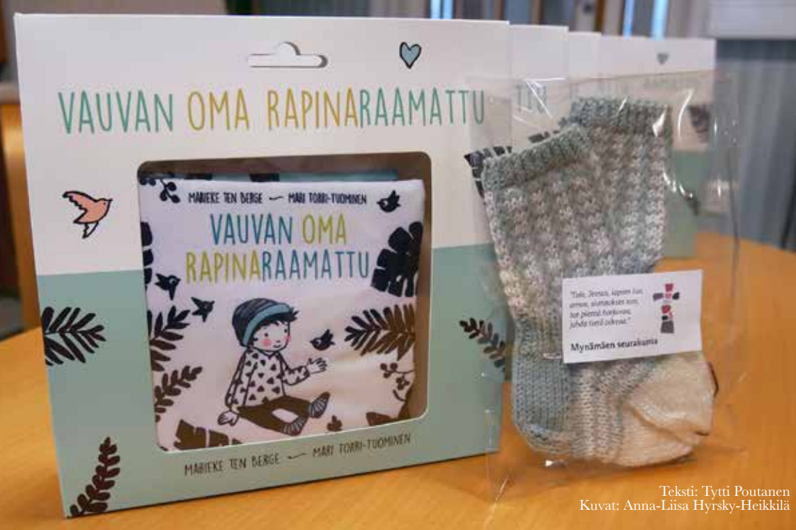
Teksti: Tytti Poutanen