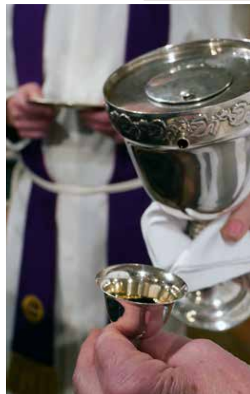
Teksti: Anni-Kaisa Saarela

Toivottavasti saamme ajan myötä nostettua nähtäväksi mielenkiintoisia esineitä ja tarinoita, joita on vaikka kuinka paljon.