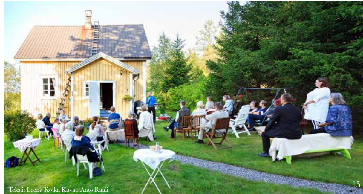
Teksti: Leena Kotka Kuvat: Anto Raali

HUOM! Pe 16.6. Karjalan kesäkerhossa kakkutarjoilu Pirjon ja Piiän viimeisen työpäivän kunniaksi.