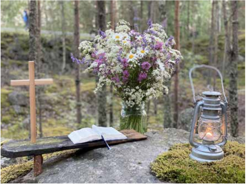
Jukolan Metsäkirkon alttari / Anna-Liisa Hyrsky-Heikkilä