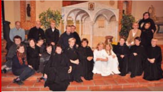
CD-levyn laulajia kirkkodraamapäivillä.

Tammikuussa 11.1.2012 klo 18.00 lasten kirkkodraamailta Karjalan kirkossa.