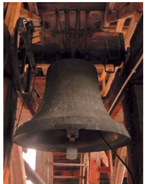
Mynämäen kirkon pieni kello vuodelta 1762.

Kellotapulissa on myös mikrofoni, jonka kautta soittoa ääni saadaan kuulumaan kirkon sisätilassa äänentoiston kautta. Tämä luo aivan uudenlaista tunnelmaa.